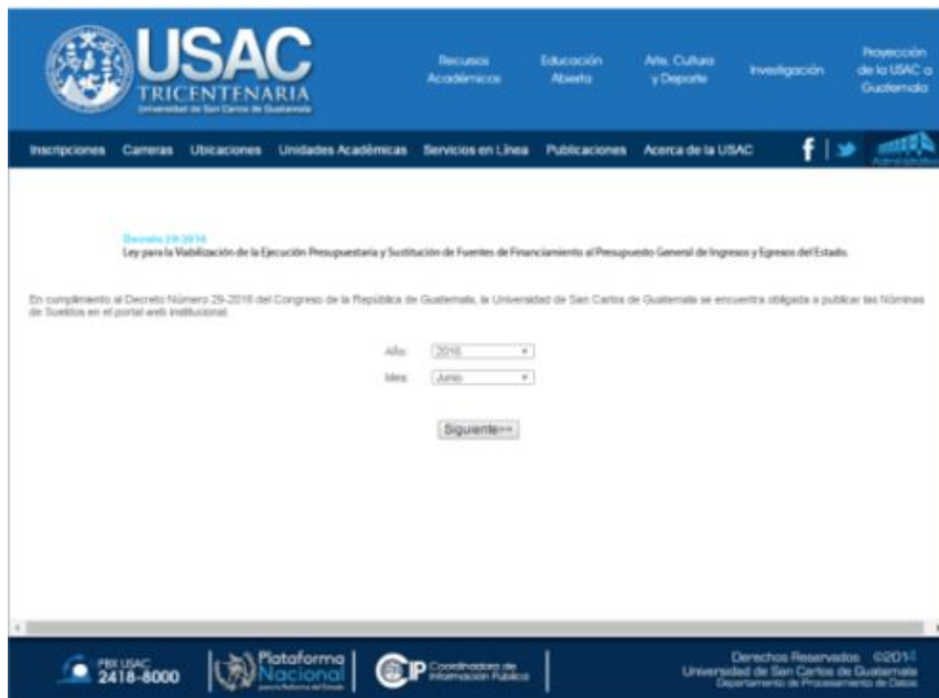
En esta pantalla se define el mes y año de lo que se desea consultar

Por lo que fue creado el módulo de transparencia que contiene la información que se publica en Internet sobre los salarios, contratos, planillas y otras rentas, y debido que el presupuesto se gasta en su mayoría en estos rubros. A continuación las pantallas que están dentro del portal de la Universidad: