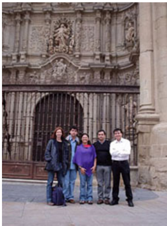
Reunión en Logroño, España.