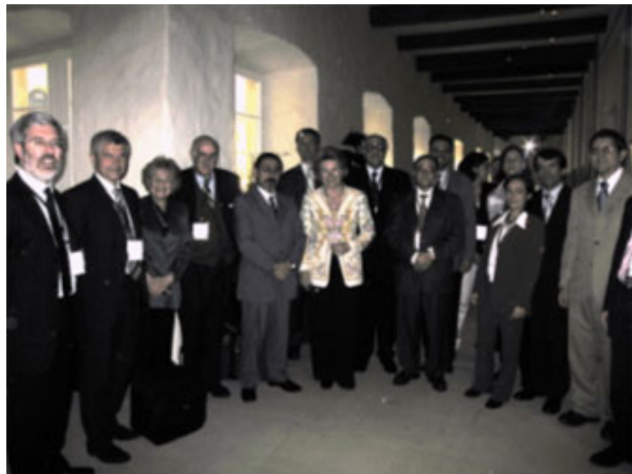
En la fotografía, los Directivos de CLARA junto a la Comisionada Reding.

El elemento clave de esta reunión fue la conversación que sostuvieron los miembros del Consejo Directivo de CLARA y el Director Ejecutivo con la Comisionada de Sociedad de la Información, Sra. Vivian Reding. Esta conversación, a la que también fueron invitados los ejecutivos de DANTE y miembros de las redes de Africa del Norte