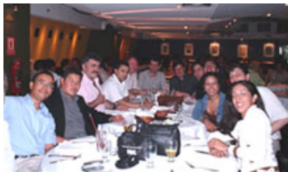
Reunión en Caracas, Venezuela.