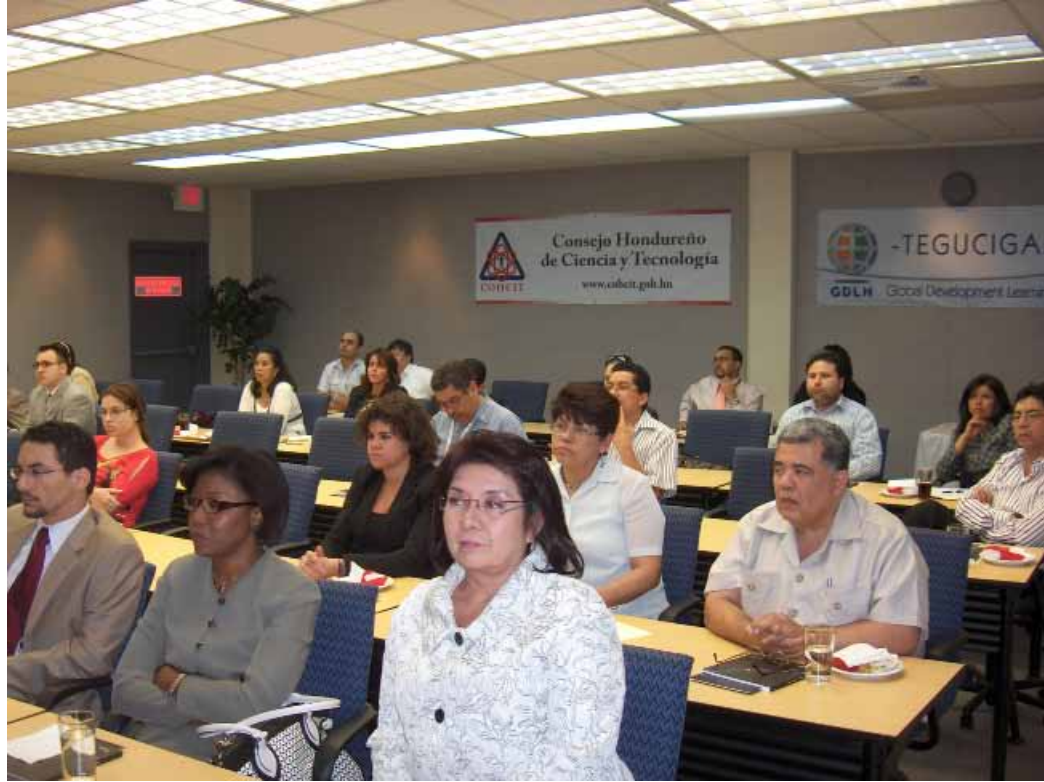
Miembros de entidades educativas y de gobierno hondureñas asistieron a las reuniones.

“En Honduras varias universidades mostraron interés y disposición de conformar la red de ellos, no importa si se llama RHUTA o como quieran llamarla, lo importante es dar el paso”, enfatizó Ibarra.