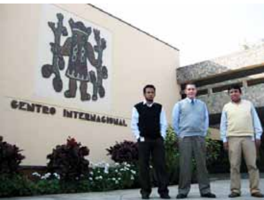
Grupo de trabajo CIP

tubérculo. De esta manera se busca disminuir la pobreza y ayudar a las personas dedicadas a la agricultura. "Puede ser que una variedad de papa sea resistente a una plaga y otra a la sequía. Otra variedad puede ser la más productiva y tener las mejores características para cocinar. Por medio del análisis genético se trata de hacer cruces con las mejores características de las distintas especies. Lo