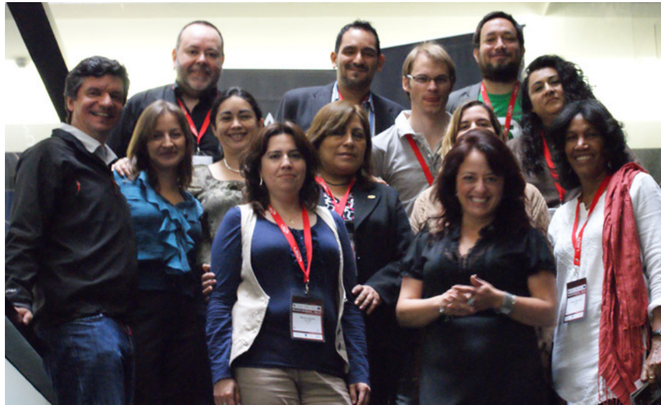
Grupo LA NRENs PR Network