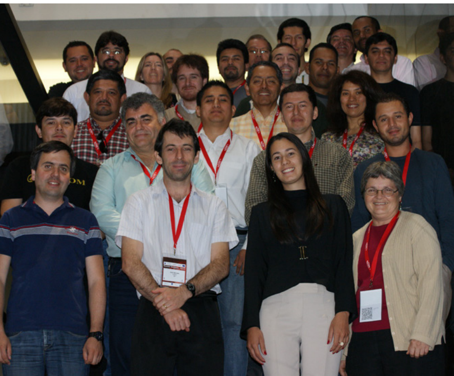
Capacitación en CLARA-TEC

En noviembre, durante una semana, el mundo de las redes avanzadas se concentró en Montevideo, Uruguay, ciudad donde se llevaron a cabo las segundas reuniones anuales de los tracks ejecutivos, técnicos, de comunicaciones y de capacitación del proyecto ALICE2 y RedCLARA. El evento marcó los planes para los siguientes años y las perspectivas de fortalecimiento de RedCLARA en la región.