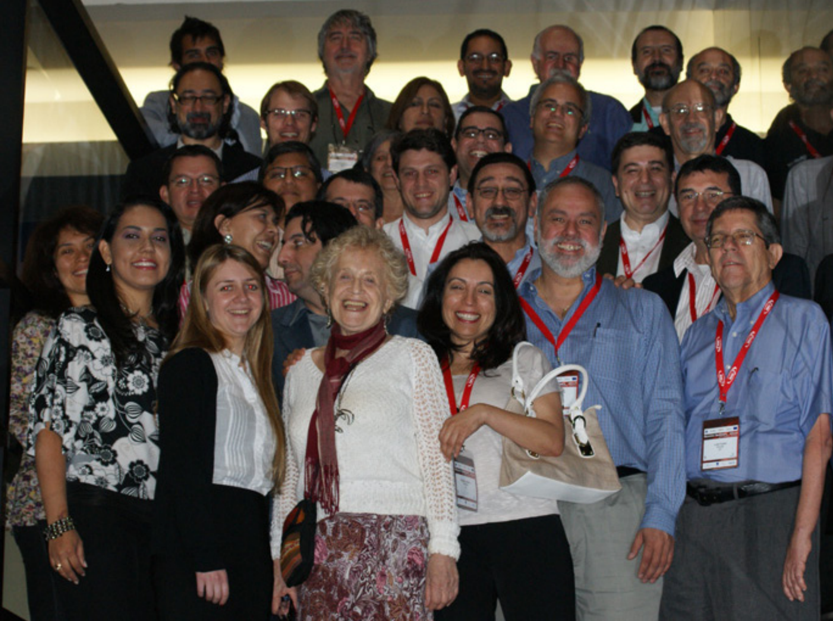
Miembros ALICE2 y RedCLARA